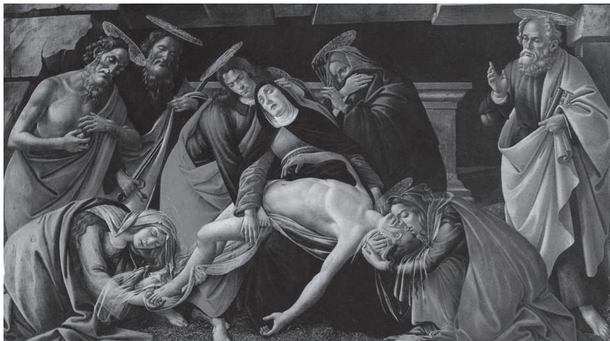
Beweinung Christi von Sandro Botticelli (ca. 1490)