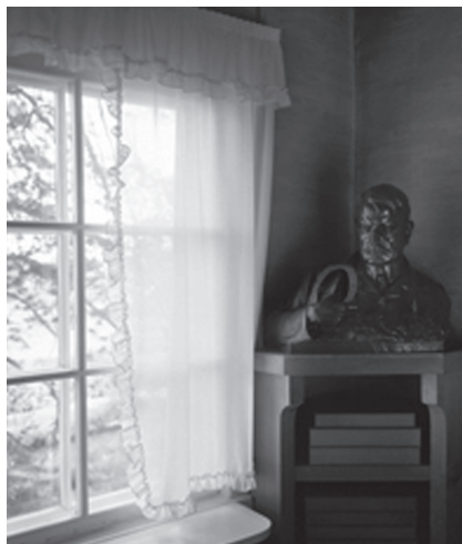
Blick aus der Villa Ainola, Järvenpää

Järvenpää, ein kleines Dorf 40 Kilometer von Helsinki entfernt, am Ufer des Tuusulanjärvi-Sees. Dorthin flüchtet Jean Sibelius im September 1904 zusammen mit seiner Frau und seinen fünf Töchtern – gezeichnet vom exzessiven Künstlerleben der finnischen Hauptstadt. Ainola, so heißt die Villa, in die die Familie zieht und die nach seiner Frau benannt ist. Das Haus ist schlicht, aber ganz nach den Wünschen des Komponisten eingerichtet, fließendes Wasser gibt es nicht. Aus dem Fenster seines Arbeitszimmers im ersten Stock kann er auf das Ufer des Sees blicken. Alles ist darauf ausgerichtet, dass sich Sibelius auf das Wesentliche konzentrieren kann – das Komponieren. »Meine Kunst fordert ein anderes Milieu. In Helsinki starb aller Gesang in mir. (...)