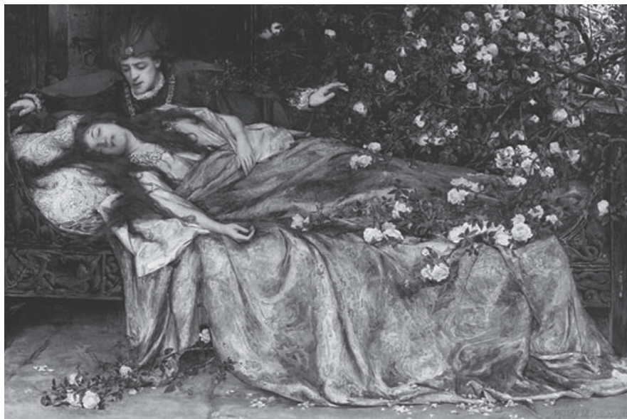
Henry Meynell Rheam: Dornröschen. Aquarell 1899

ne Ballettsuite im Stile Prokofjews oder Tschaikowskys als eine Art Appetitanreger zu ihrem eigentlichen (Handlungs-) Ballett bezeichnen. Im Falle Tschaikowskys erschienen die Suiten allerdings – mit Ausnahme der Nussknacker -Suite, die bereits vor der Premiere des Balletts erklang – quasi als musikalisch-dramaturgischer Aus- oder Querschnitt der umfanglichen Ballettpartitur. Insbesondere die Vertonung des Dornröschen -Märchens hatte es ihm angetan. »Das Sujet ist überaus sympathisch und poetisch«, schrieb Tschaikowsky seiner Mäzenin Nadeshda von Meck am 8. Januar 1889, um ihr einige Monate später vorzuschwärmen: »...Mir