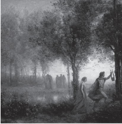
Jean-Baptiste Corot. Orpheus führt Eurydike durch die Unterwelt. 1861. Museum of Fine Arts Houston, Texas

gorischen Figur La Musica und ersetzt den Chor des antiken Dramas) auf den Weg zum Olymp, um Eurydike von Göttervater Jupiter zurück zu ordern. Die Geschichte scheint wie im Mythos auszugehen: Orpheus blickt sich auf dem Weg in die Welt der Sterblichen nach Eurydike um und verliert sie für immer. Hier jedoch mit einem Augenzwinkern, da er sie so endgültig los ist. Als dann die Öffentliche Meinung von Orpheus fordert, möglichst »zerknirscht und mit kläglichem Ton« die Rückgabe der Gattin zu erbitten, stimmt der Glucks berühmtes Thema der Arie » Che farò senza Euridice « an. » Was werde ich ohne Eurydike tun...? «