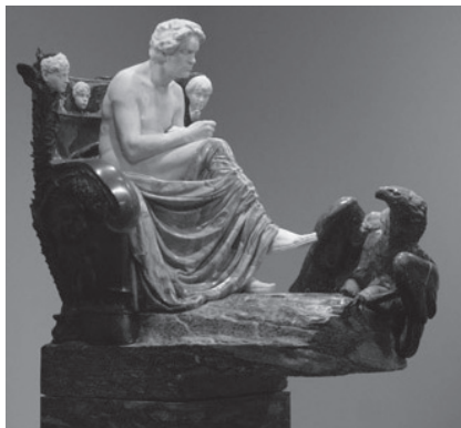
Beethovenplastik von Max Klinger (1885-1902)

schlags und der Besaitung einen rasanten Wandel durchliefen. Von dieser Geschichte erzählt auch die Waldstein-Sonate , in der gleichzeitig verschiedene Stadien, Ideen und Ideale des Klavierspiels präsent sind: die Transparenz, Trennschärfe und figurative »Spritzigkeit« des Cembalos, das Legato des Orgelchorals, die Poetik des neuen Hammerklaviers bzw. des Fortepianos mit seinem unvergleichlich sonoren und silbrigen Klangbild. Der bereits genannte Adolf Bernhard Marx sieht in der Sonate die »Natur der Tasteninstrumente« und die »Wonne der Spielseligkeit«. Und dieser Natur kommt Beethoven bereits im ersten Satz entgegen. Irisierende, straff im Tempo und transparent gehaltene Akkordrepetitionen und modulierende Motivfetzen (wie auf einem Cembalo »geschlagen«) begegnen einem gebunden-choralhafte Thema in E-Dur (wie einem Orgelchoral nachemp-